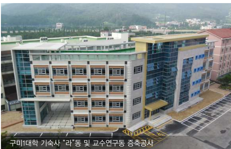
구미대 기숙사 "라"동 및 교수연구동 증축공사