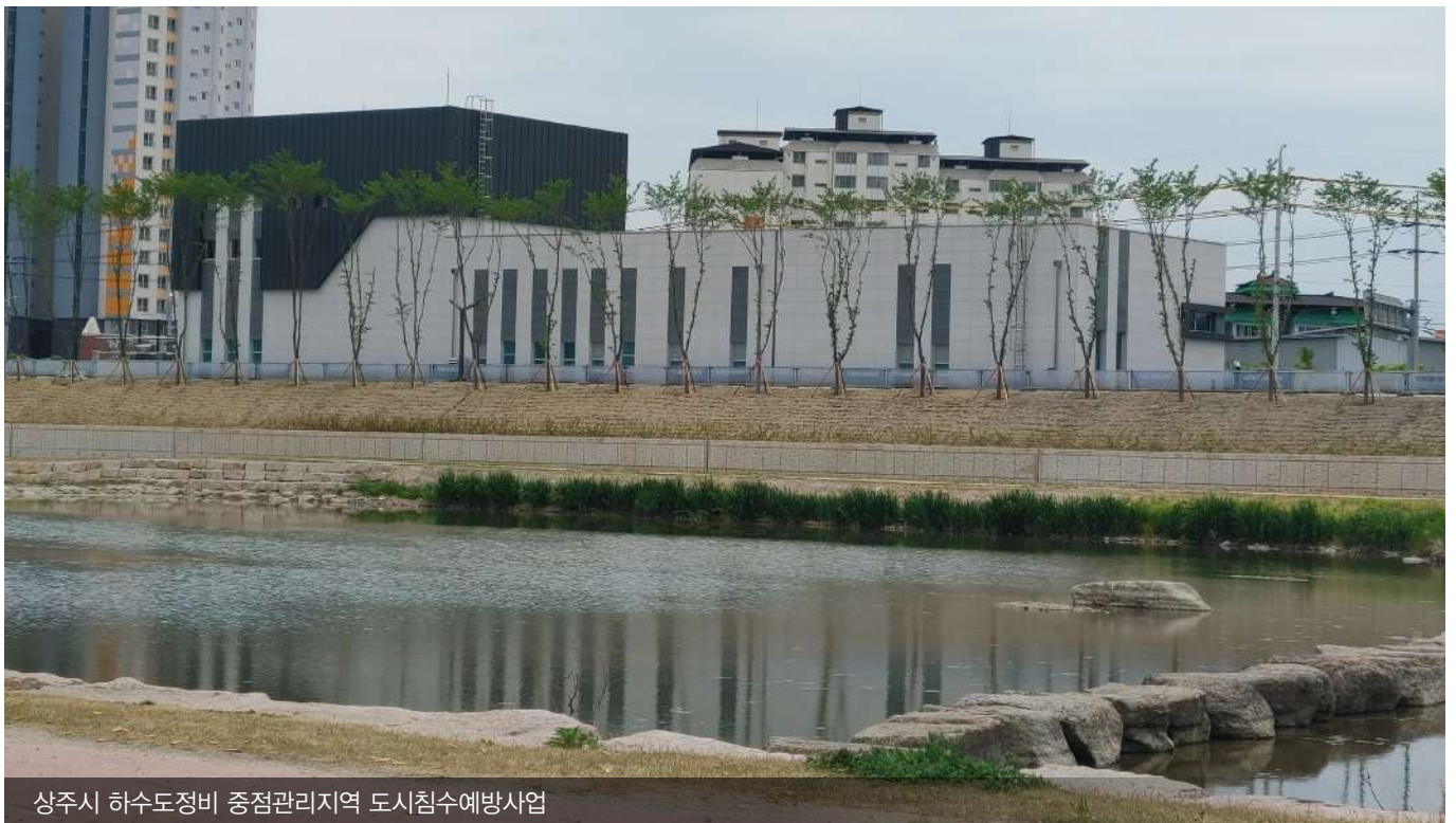
상주시 하수도정비 중점관리지역 도시침수예방사업