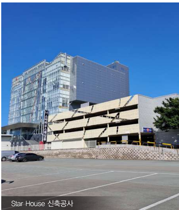
Star House 신축공사