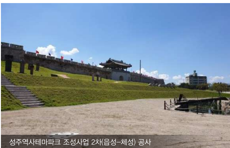
성주역사테마파크 조성사업 2차(읍성-체성) 공사