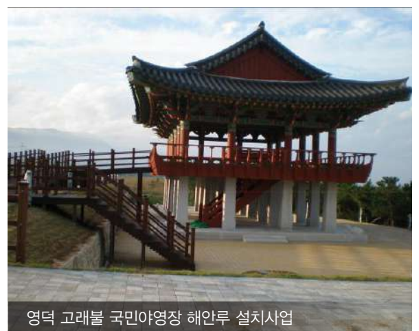
영덕 고래불 국민야영장 해안루 설치사업