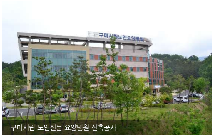
구미시립 노인전문 요양병원 신축공사