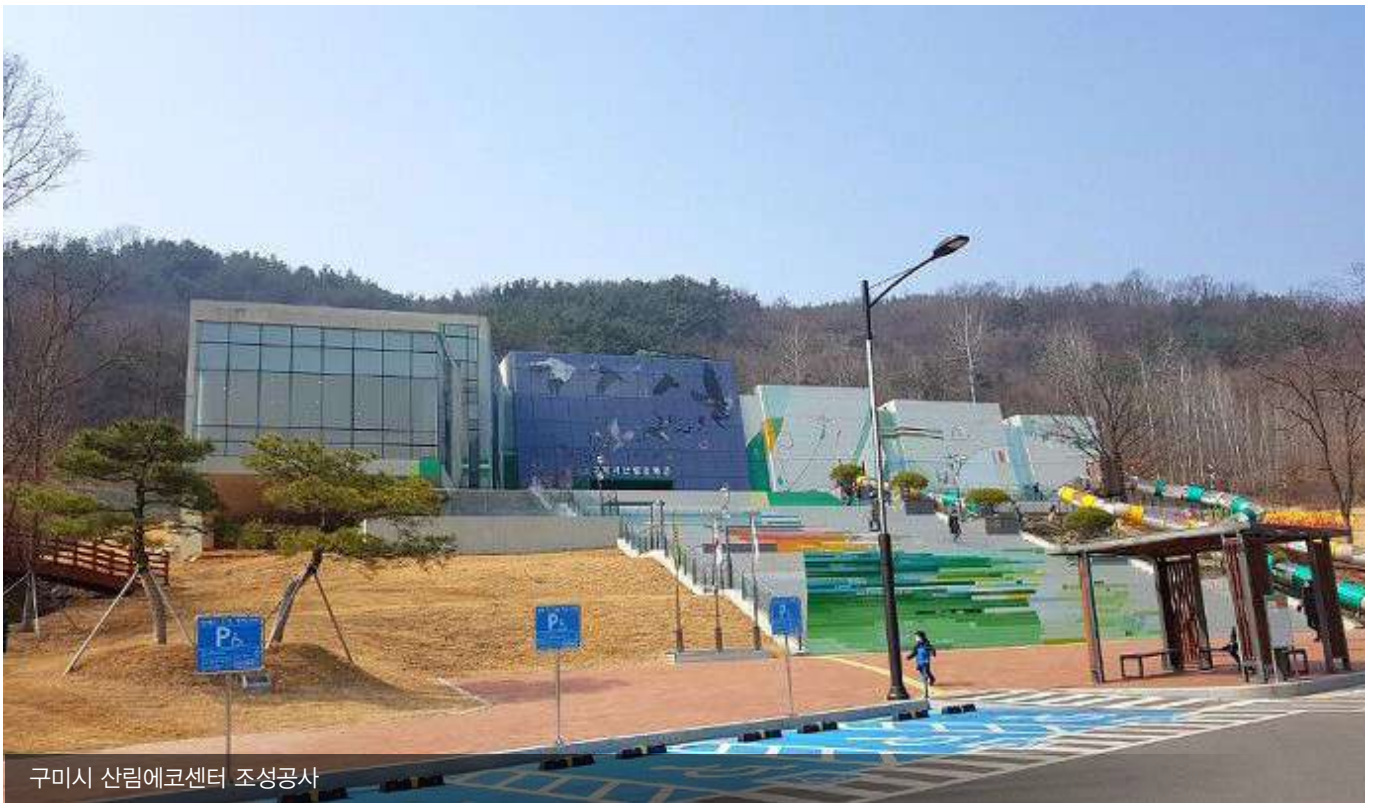
구미시 산림에코센터 조성공사