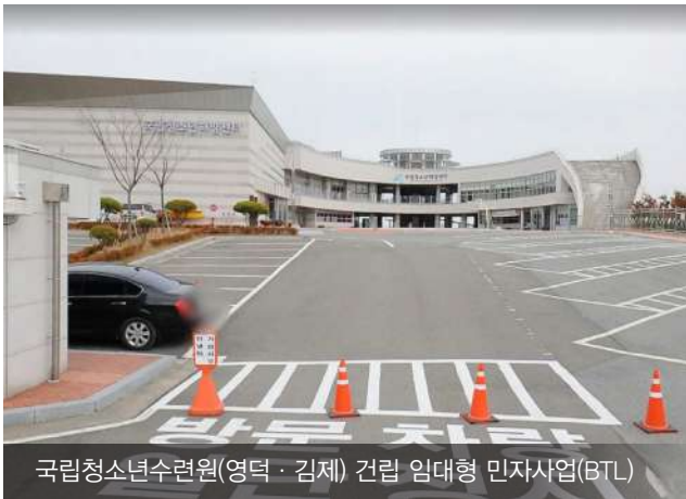
국립청소년수련원(영덕·김제) 건립 임대형 민자사업(BTL)