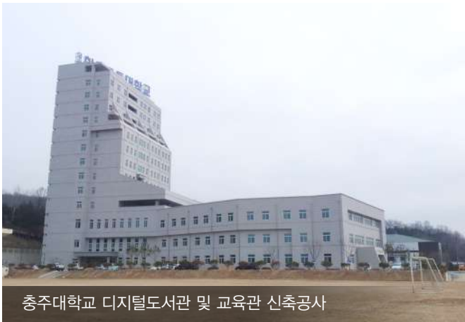
충주대학교 디지털도서관 및 교육관 신축공사