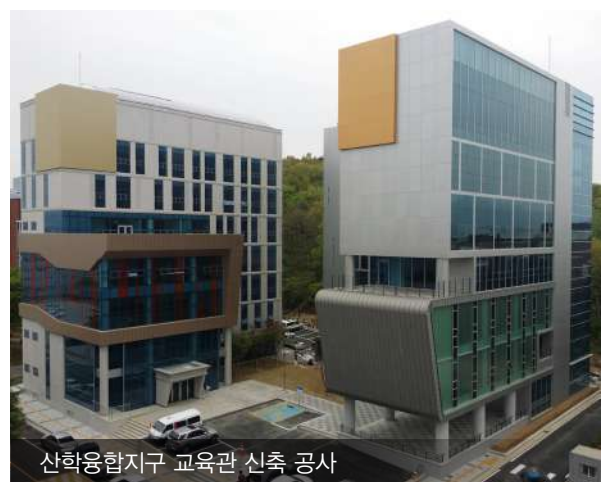
산학융합지구 교육관 신축 공사