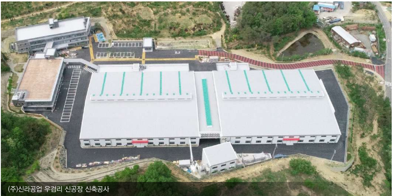
(주)신라공업 우검리 신공장 신축공사