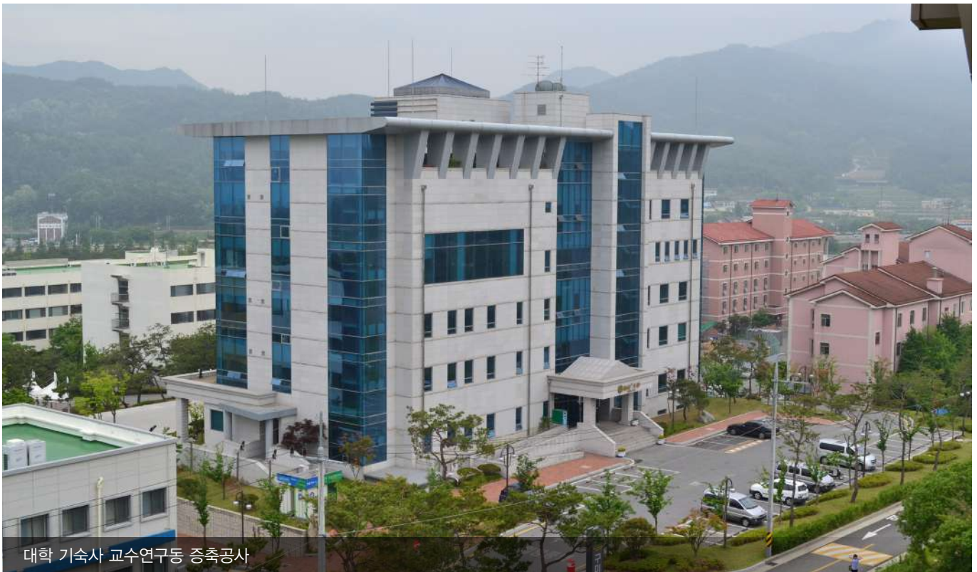
대학 기숙사 교수연구동 증축공사