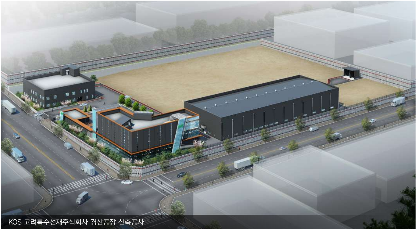
KOS 고려특수선재주식회사 경산공장 신축공사